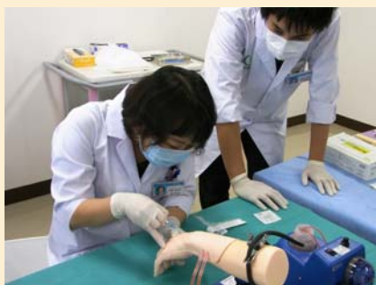
針を刺す表情は真剣です