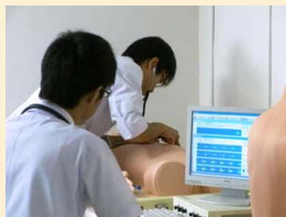
あらゆる角度から確認…