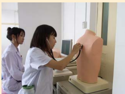
こんな風に聴こえるんだ…