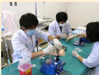
手順を確認しながら…