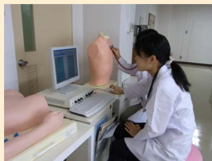
モニタでの確認も忘れずに