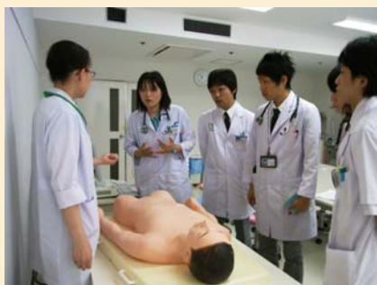
最初に説明を受けます