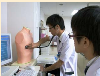
この辺の音はどうなんだろう？